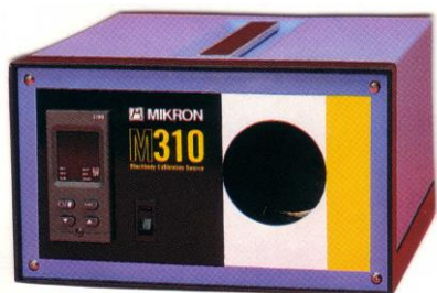
M310HT 型 室温+5~450℃